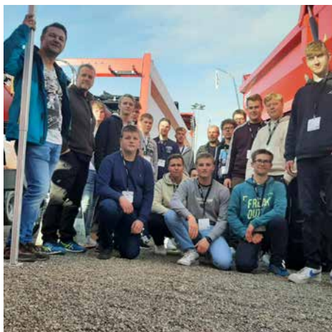
2022 – Besuch der Messe „BAUMA“ in München.