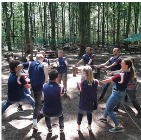
2021 – Kletterwald Haltern am See.