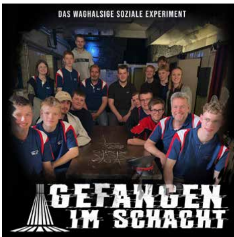
2023 – Escape-Room in Dorsten.

KRAMPE FAHRZEUGBAU GMBH Zusestraße 4, D-48653 Coesfeld, www.krampe.de