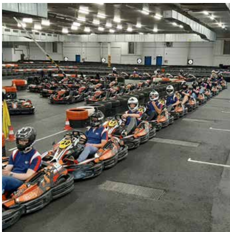
2022 – Kartfahren in Bocholt.